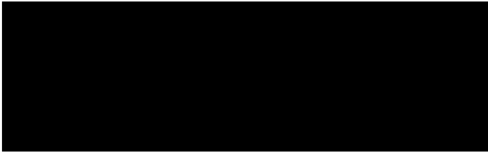
Abbildung 2: Karte des Landes 3